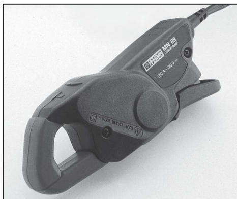
Proudové kleště MN77