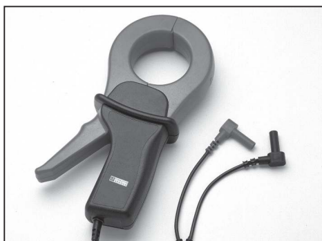
Proudové kleště C177